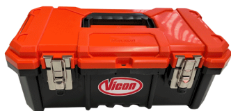
Kit de ferramentas